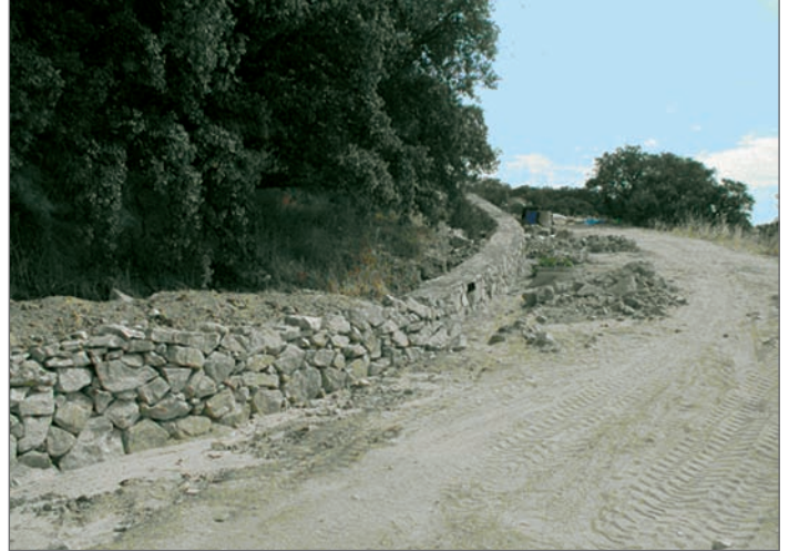
Construcción de muro de mampostería

Todas estas actuaciones favorecerán la recarga de acuíferos y la mejor distribución del agua dentro de la cuenca.