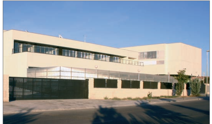
En la imagen, el CEIP Los Olivos en El Cantizal

Este es el curso en el que ha comenzado su andadura el CEIP Los Olivos, situado en El Cantizal,- Camino de Perales-. Este nuevo colegio cuenta con dos edificios, uno destinado a Infantil y otro a Educación Primaria, así como un tercero que alberga un gran gimnasio. El colegio ofrece, desde el mismo día de su apertura todos los servicios,- comedor, los primeros del cole, etc., cuenta, además con dos comedores.