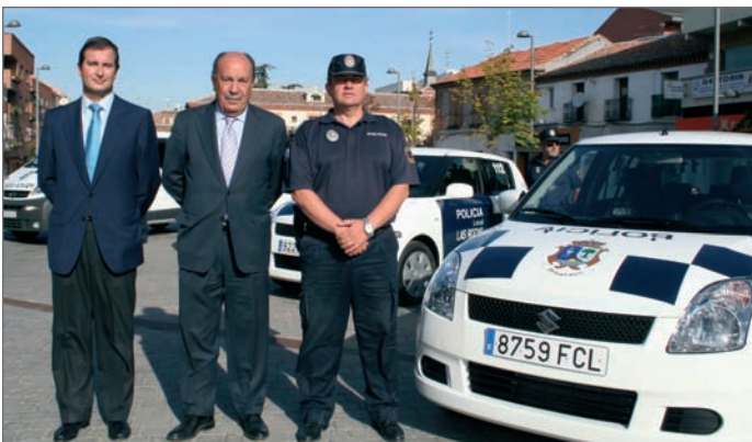
De izq. a der., el Concejal de Seguridad, el Alcalde de Las Rozas y el Jefe de la Policía Local

La Policía Local cuenta, desde comienzos de otoño, con 6 nuevos vehículos. Esta dotación está compuesta por 3 turismos, una furgoneta y 2 vehículos camuflados . Con la incorporación de éstos, el Ayuntamiento de Las Rozas continúa cumpliendo con su objetivo de modernización de la flota de la Policía Local, con la intención de mejorar la eficacia y rapidez en el servicio al ciudadano.