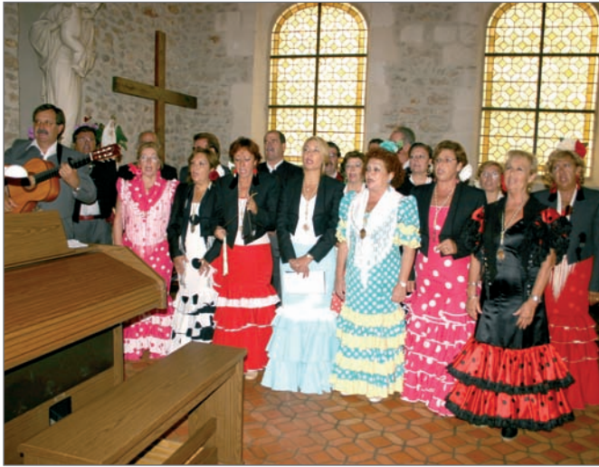
El Coro Rociero cantando la Salve en la Iglesia de San Cosme y San Damián en Villebon

Las relaciones de hermanamiento con el municipio francés Villebon sur Yvette continúan con muy buena salud. Siguiendo la tradición, una delegación roceña, encabezada por los Concejales de Presidencia y de Actos Civiles y compuesta por el Coro Rociero de Las Rozas se trasladó al municipio hermano para celebrar las Fiestas Patronales de San Cosme y San Damián y la entrega de la Bandera de Honor del Consejo de Europa. El coro cantó en la misa celebrada con motivo de la Festividad de los Patronos, demostrando una vez más su maestría a la hora de emocionar.