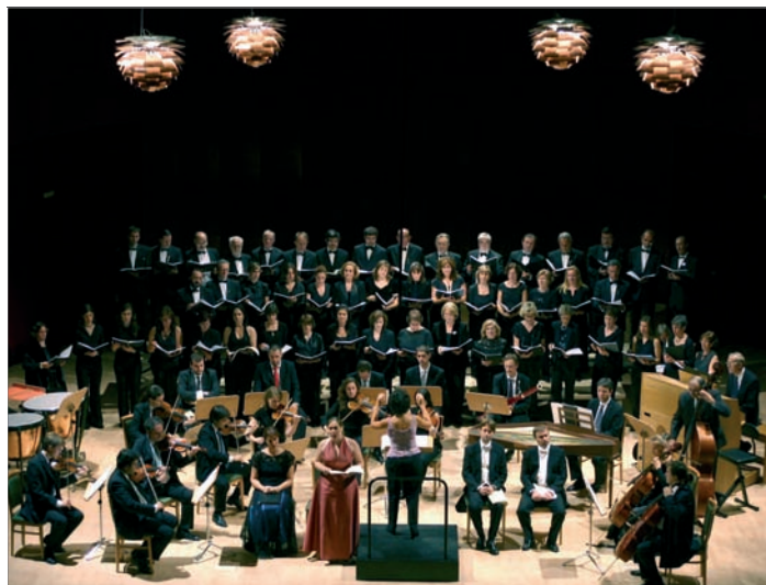
En la imagen, el Coro Villa de Las Rozas acompañado por la Orquesta del Coro Villa de Las Rozas