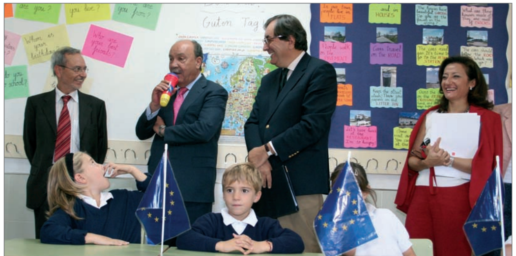
De izquierda a derecha, el Director Territorial de Madrid Oeste, el Alcalde de Las Rozas y representantes de la Agencia Europea