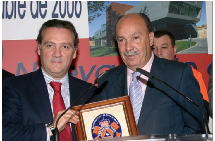
El Vicepresidente segundo y Consejero de Justicia e Interior de la Comunidad de Madrid recibiendo una placa de SAMER - Protección Civil de manos del Alcalde de Las Rozas